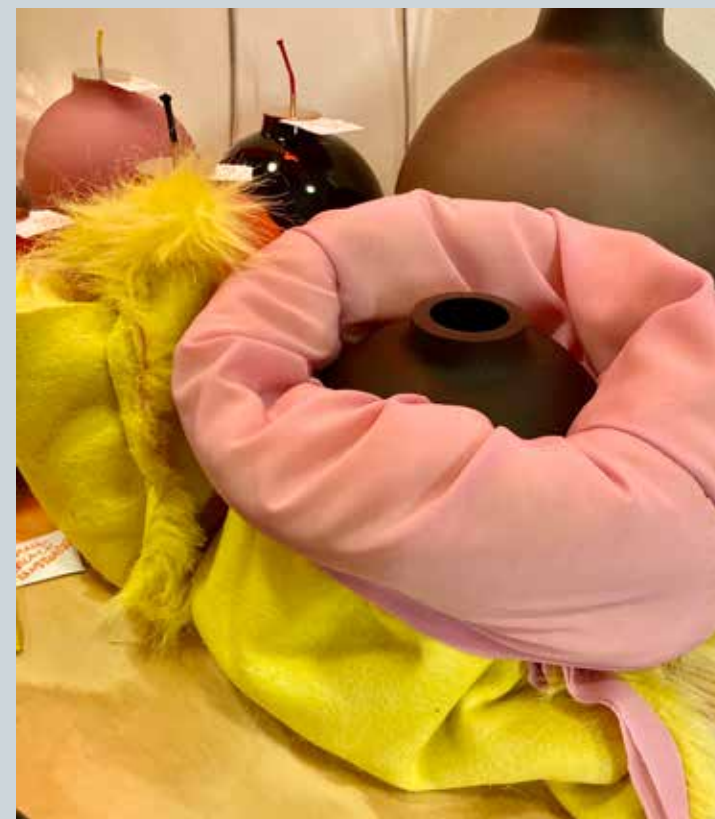
PACKADE KONSTVERK I SPECIALSYDDA PÅSAR ©NINA WESTMAN/BILDUPPHOVS RÄTT (2023).

och tänkte att konsttransportfirman skulle ha koll på det. Men de packade med makulaturpapper som är rätt hårt och det repade mina verk. Så jag fick åka och hämta verken och göra om ytbehandlingen. Detta var givetvis inte transportfirmans fel utan jag lärde mig att just de grejerna måste jag göra egna lösningar till. I det här fallet sy mjuka påsar till objekten.