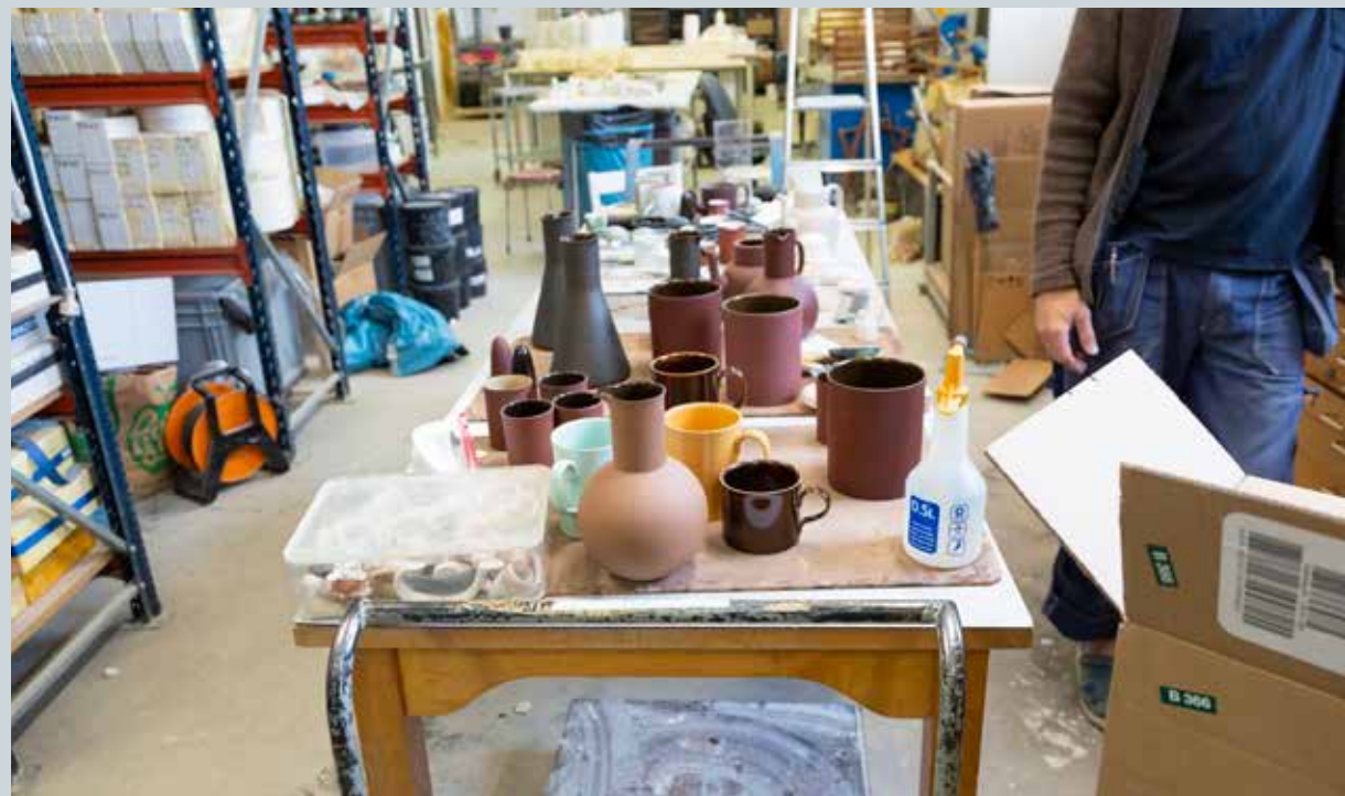
KERAMIKFÖREMÅL I ATELJÉN ©JONAS LINDHOLM/BILDUPPHOVS RÄTT (2023). FOTO: NADJA BREČEVIĆ

Jonas säljer sin keramik via olika återförsäljare och har hittills inte haft försäljning direkt till privatkunder, men är pre-