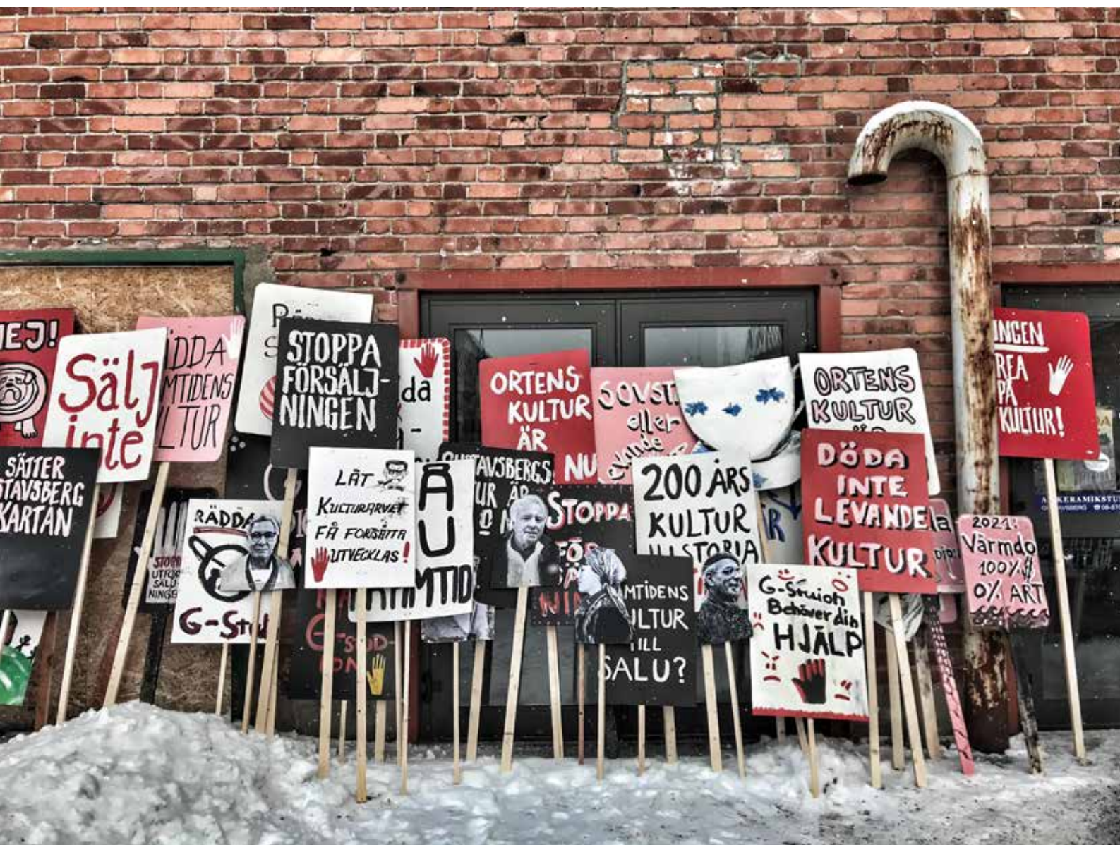
G-Studio är bara en i raden av ateljéföreningar i Stockholm som hotas att rivas eller säljas.

"Frågan inställer sig: var ska alla konstnärer arbeta?"