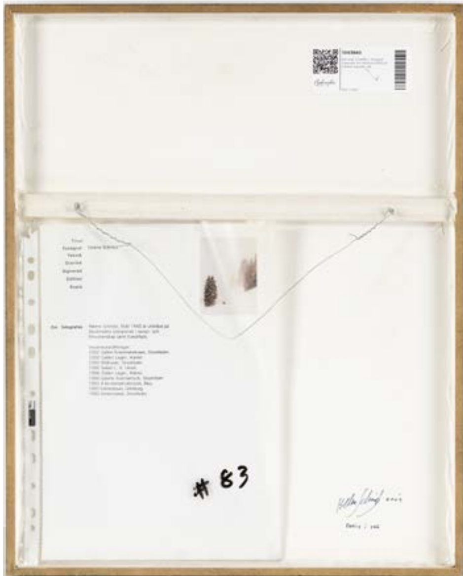
På fotografen Helene Schmitzs "Familj i snö 4", signerad och daterad 2004 på ramens baksida, har äkthetsintyget i en plastficka fästs direkt på baksidan av den inramade bilden.